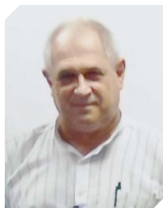
O Prof. Ms. Moacir alertou para a importância de se prevenir acidentes no trabalho