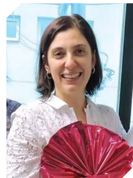
Dra. Julianna citou que, depois dos policiais e dos controladores de voo, os profissionais da saúde são os mais estressados