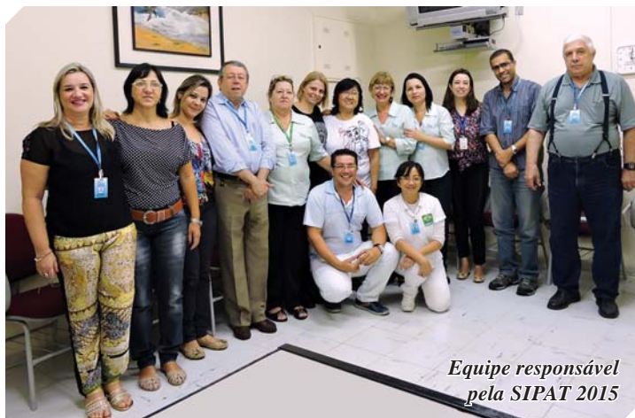
Equipe responsável pela SIPAT 2015

Realizada no auditório do Centro de Diagnósticos, a Semana Interna de Prevenção de Acidentes do Trabalho (SIPAT) contou ainda com distribuição de brindes, preservativos e folhetos informativos sobre doenças. No último dia, fisioterapeutas percorreram os Centros Diagnóstico e Neurológico para ensinar e incentivar os funcionários da Casa da Esperança a adotarem a prática da ginástica laboral no início e no meio da jornada de trabalho.